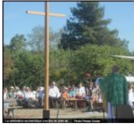
Deux paroisses réunies sur le Mont-Juillet - Presse Océan 15 septembre 2022 - 2/2