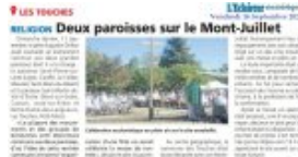
L'Eclairer vendredi 16 septembre 2022