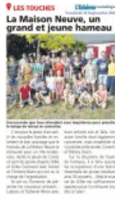
L'Eclairer vendredi 16 septembre 2022