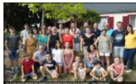
Presse Océan 17 septembre 2022