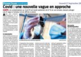
Presse Océan 17 septembre 2022