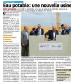
Eau potable : une nouvelle usine - Presse Océan 15 septembre 2022