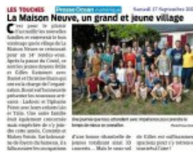
Presse Océan 17 septembre 2022