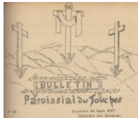
La croix au centre sur laquelle Jésus est mort