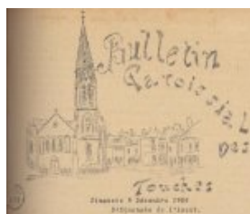
L'église et le bourg