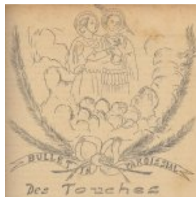
Saint Donatien et Saint Rogatien martyrs