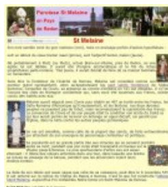
St Melaine conseiller de Clovis