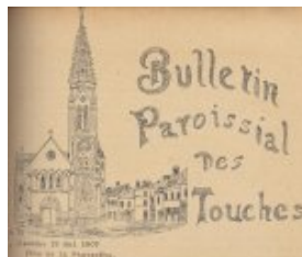
L'église et le bourg