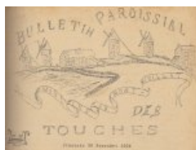
Les moulins du Mont Juillet