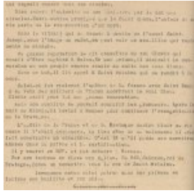
Dans le vitrail à droite de l'autel St Joseph on peut voir ce qui représente ce miracle