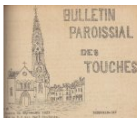
L'église et le bourg