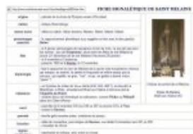
Fiche signalétique de St Melaine