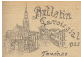
L'église et le bourg