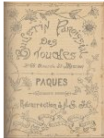
Pâques Résurrection de N.S. J.-C.