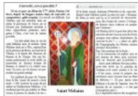
St Melaine devenu évêque de Rennes ressuscite un enfant