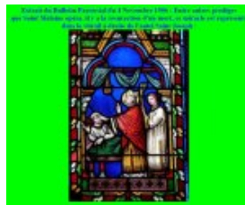
Le vitrail dans l'église des Touches représentant le miracle de la résurrection d'un mort