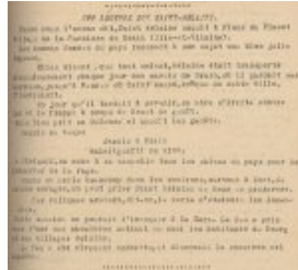
St Melaine naquit dans un village de la Paroisse de Brain (Ille-et-Vilaine), une légende sur St Melaine