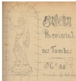
Le Christ et sa croix