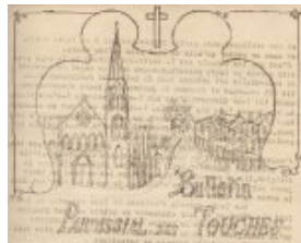
L'église et le bourg