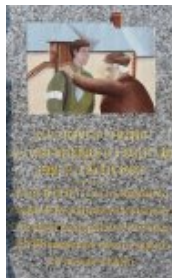
La Stèle avec l'inscription qui est sur une plaque apposée sur le mur de la ferme