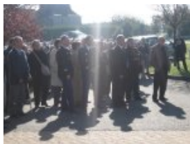
Personnalités et participants devant la salle polyvalente