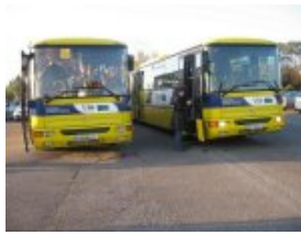
Autocars parking du Mont Juillet pour le transport entre le bourg et la Maison Rouge