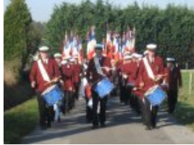
Le défilé vers le retour au bourg de Les Touches