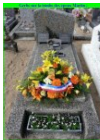
Une gerbe de fleurs a été déposée sur la tombe des époux Martin