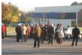
Participants sur le parking avant le départ pour la Maison Rouge