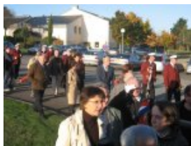
Participants sur le parking avant le départ pour la Maison Rouge