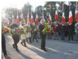
Les Personnalités avec les gerbes de fleurs avancent vers la Stèle