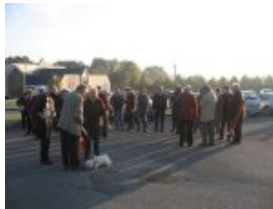
Participants sur le parking avant le départ pour la Maison Rouge