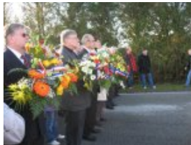
Les Personnalités et gerbes de fleurs