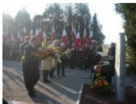
Dépôt de gerbe de fleurs devant la Stèle