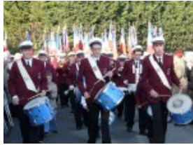
La musique des Touches en tête du défilé