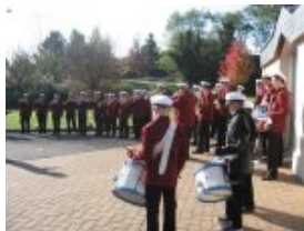
La musique devant la salle polyvalente de Les Touches