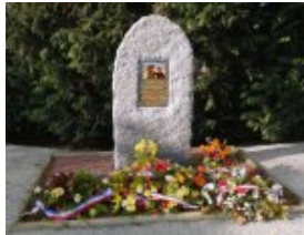
La Stèle et les gerbes de fleurs