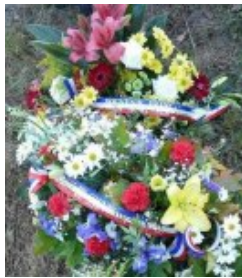
Gros plan sur une gerbe de fleurs