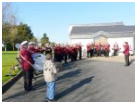
La musique devant la salle polyvalente de Les Touches