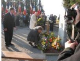
Dépôt de gerbes de fleurs devant la Stèle