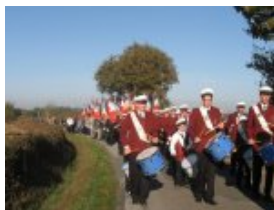
La musique, les porte-drapeaux et participants vers le retour au bourg de Les Touches