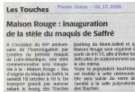
Inauguration de la stèle à la Maison Rouge, transport gratuit par autocar - Presse Océan 6 octobre 2008