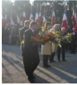
Personnalités avec gerbes de fleurs devant la Stèle