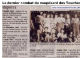
Le dernier combat du maquisard des Touches - Presse Océan 18 octobre 2008