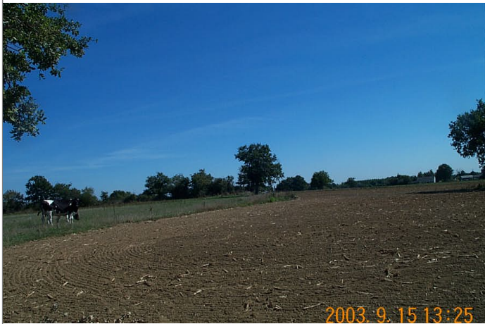
Azimut de la prise de vue : 110 gr