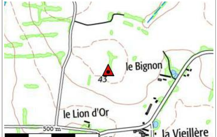
Carte : 1322 ANCENIS