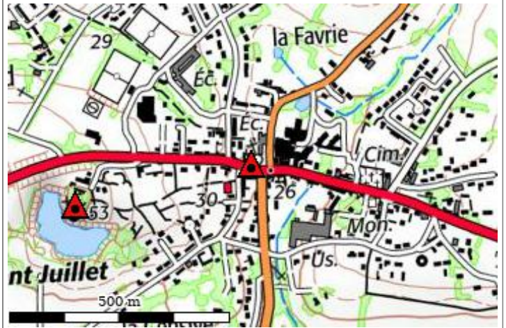
Carte : 1322 ANCENIS