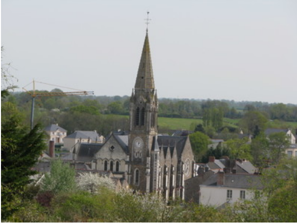
Azimut de la prise de vue : 85 gr