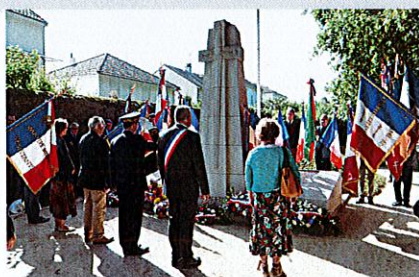
Détail des animations au verso

En présence de Monsieur Fabrice RIGOULET-ROZE, Préfet de la Région Pays de la Loire, Préfet de la Loire-Atlantique, Monsieur le Maire de Saint-Herblain et Madame la Maire de Saffré.